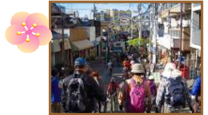
H23.12.18東京都「上野・根津・谷中」