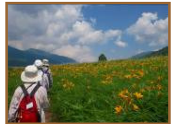
H23.7.17野反湖ハイキング