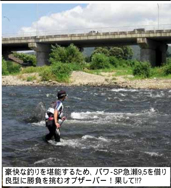
豪快な釣りを堪能するため、パワ-SP急瀬9,5を借り良型に勝負を挑むオブザーバー！果して!!?